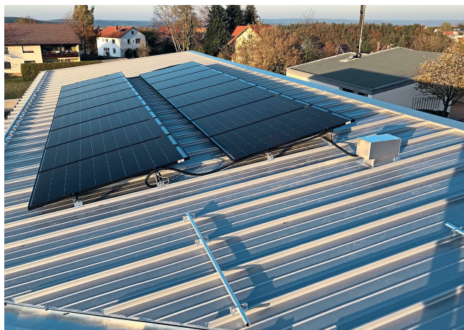
16 von 32 PVT-Kollektoren auf dem Dach der Seniorentagesstätte Johannesberg.