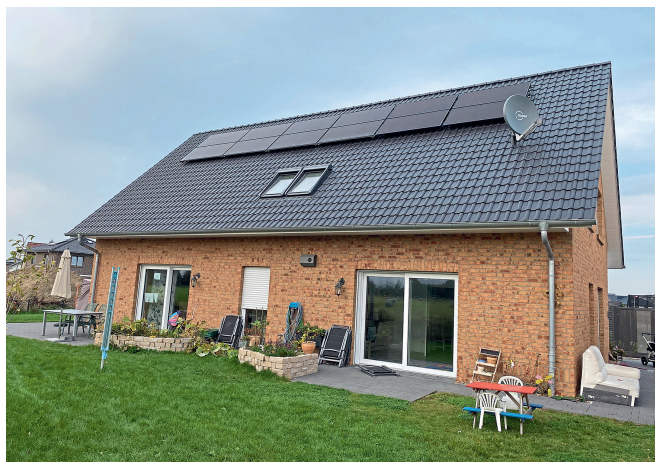
Im niedersächsischen Harsefeld heizt und kühlt eine Familie ihr neues Viebrockhaus bereits seit über einem Jahr mit einer Wärmepumpe, die über ein PVT-Kollektorfeld auf dem Dach die Umgebungs- und Strahlungswärme der Sonne nutzt.